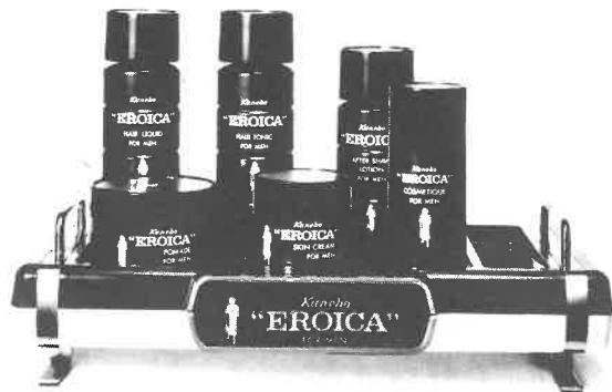
紳士用化粧品エロイカシリーズ

エロイカのあの独特の清涼感とまろやかさ、 心にゆとりを生む気品ある香り。英雄は英雄 を知るとか。エロイカは、おたくのサウナに 一級のお客さまを呼ぶでしょう。